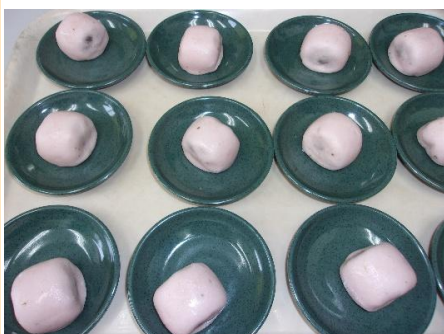
桜のおまんじゅう