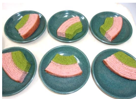
桜とヨモギの バウムクーヘン

季節にちなんだおやつを皆さんに味わっていただきました。桜風味のお菓子には香りや成分による心身へのリラックス効果などがあるようです。ちなみに桜餅に使われる「塩漬の葉」は血流をサラサラにする効果があるようです。血管の健康維持にも良いとのこと。